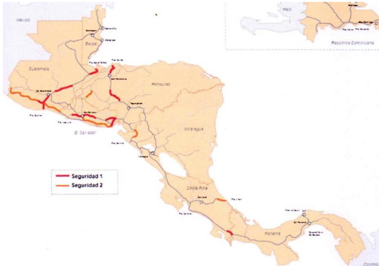
Gráfico 4: Medidas de seguridad adoptadas para el TAC. Porcentaje sobre total carga transportada

Mapa en revisión